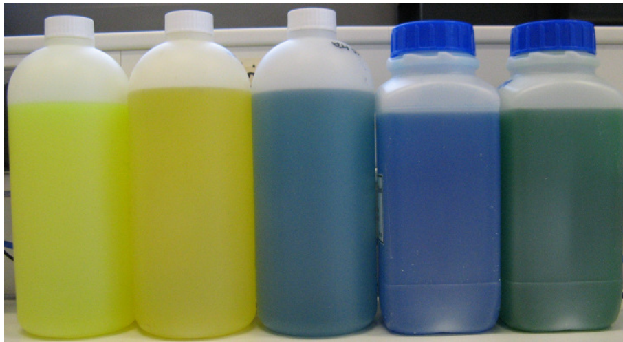
Abbildung 2 Wärmeträgerfluide.

Aus Sicht des vorsorgenden Grundwasserschutzes können derzeit der hohe Organik-Gehalt sowie die in den meisten Formulierungen enthaltenen Triazole als Hauptprobleme von Wärmeträgerfluiden benannt werden. Es ist außerdem davon auszugehen, dass die Formulierungen weitere, bislang nicht identifizierte Substanzen – wie z.B. Farbstoffe – enthalten (Abbildung 2).