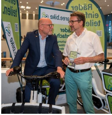
Winfried Hermann, Verkehrsminister von Baden-Württemberg auf dem Messestand von Teilrad