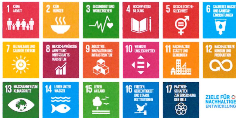
Abbildung 1 SDG's - Sustainable Development Goals der vereinten Nationen

Sodann führten die Teilnehmenden gemeinsam eine Wesentlichkeitsanalyse durch, die aus den vier Schritten besteht: